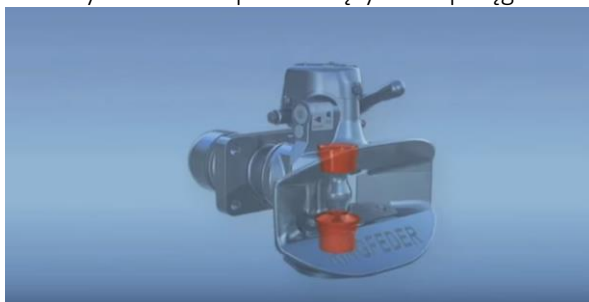
Wymiana tulei prowadzących w sprzęgu