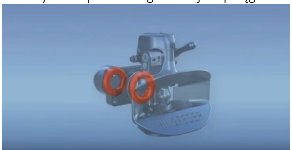
Wymiana podkładki gumowej w sprzęgu