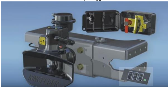
Działanie sprzęgu AM