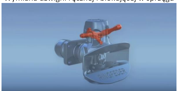
Wymiana dźwigni ręcznej i blokującej w sprzęgu