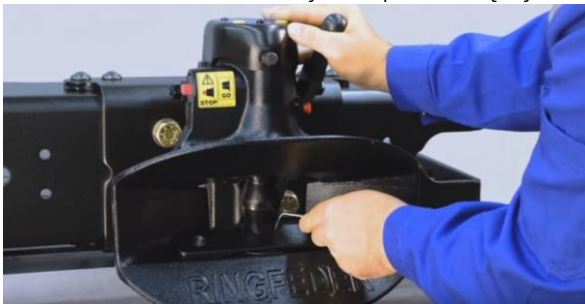
Kontrola luzu w dolnej tulei prowadzącej