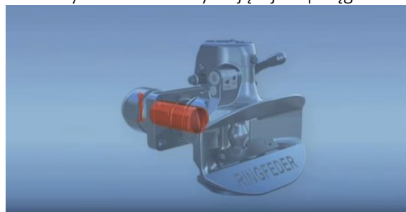
Wymiana tulei łożyskującej w sprzęgu