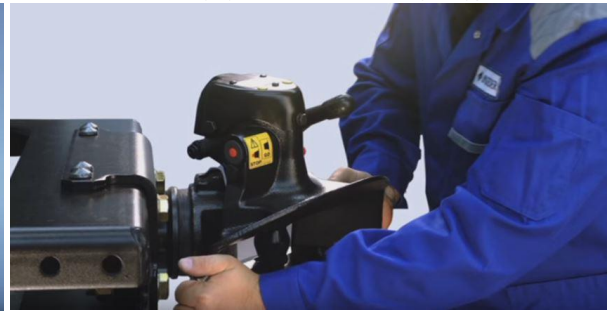
Kontrola płynności obrotu sprzęgu