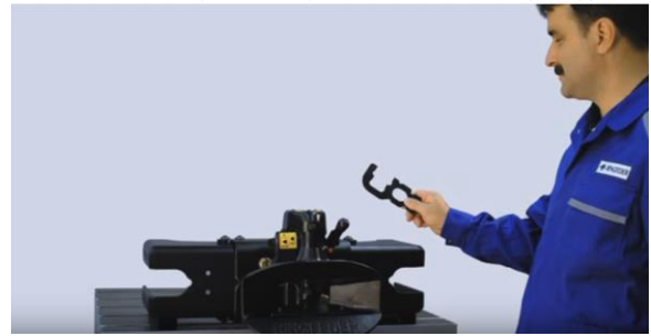
Kontrola stopnia zużycia sworznia w sprzęgu