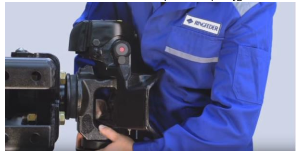
Kontrola luzu osi łożyska w sprzęgu