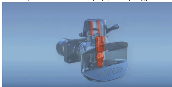
Wymiana sworznia i sprężyn w sprzęgu