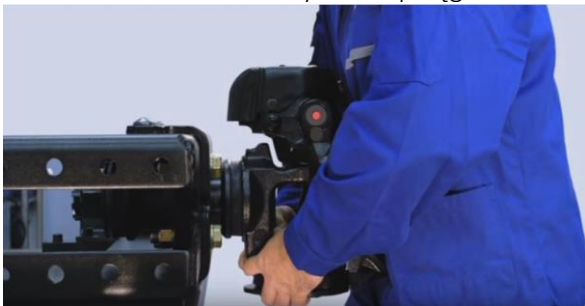
Kontrola luzu łożyska w sprzęgu