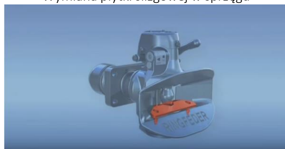
Wymiana płytki ślizgowej w sprzęgu