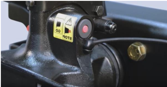
Montaż czujnika zamknięcia sprzęgu