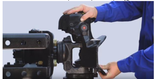
Kontrola luzów pionowych w sprzęgu