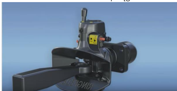
Kontrola działania sprzęgu