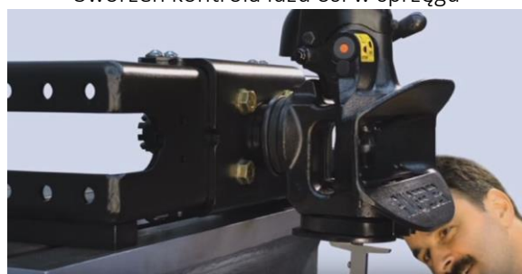
Sworzeń kontrola luzu osi w sprzęgu